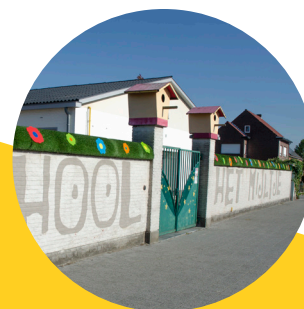
Het Mijltje Mijlstraat 66 2570 Duffel