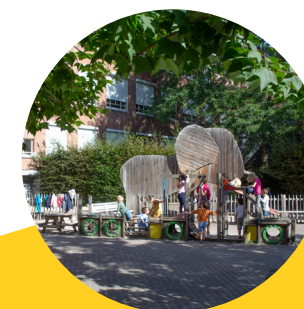
Stationsstraat Stationsstraat 4 2570 Duffel