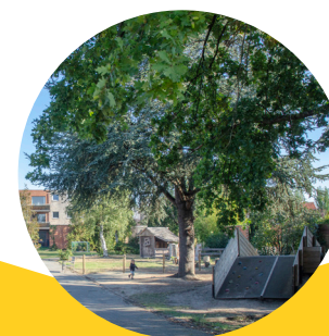
De Beunt Meertsveldstraat 7b 2570 Duffel